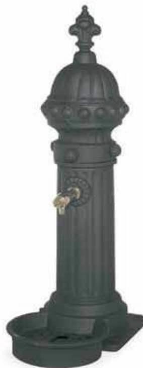
vista frontal 1:20