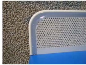
Vista del perfil de la red sin ángulos punzantes

Red de 1520x127 mm. con redondo macizo perimetral de 12 mm. de diámetro, chapa troquelada de 2 mm. de grueso, soldaduras discontinuas para formar conjunto. 5 Taladros de diámetro 12 mm. para fijación con la dos partes de la mesa. Zincado y posterior pintado color blanco.