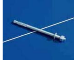
Perno de anclaje de la mesa al suelo (la garantía es total si este anclaje es correcto)