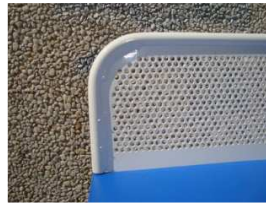
Vista del perfil de la red sin ángulos punzantes

Red de 1520x127 mm. con redondo macizo perimetral de 12 mm. de diámetro, chapa troquelada de 2 mm. de grueso, soldaduras discontinuas para formar conjunto. 5 Taladros de diámetro 12 mm. para fijación con la dos partes de la mesa. Zincado y posterior pintado color blanco.