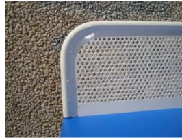
Vista del perfil de la red sin ángulos punzantes

Red de 1520x127 mm. con redondo macizo perimetral de 12 mm. de diámetro, chapa troquelada de 2 mm. de grueso, soldaduras descontinuas para formar conjunto. 5 Taladros de diámetro 12 mm. para fijación con la dos partes de la mesa. Zincado y posterior pintado color blanco.