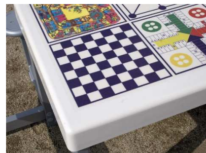
Detalle del tablero de una mesa multijuego